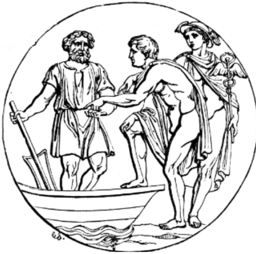
Karon, Psyke og Hermes. Illustrasjon fra en romersk lampe.

blivelsen av menneskebildet og forholdet mellom de delene som inngår i det. Da skal en merke seg at ånden, eller fornuften, – nous – er noe som oppdages som noe gitt, noe mennesket er del av, mens psyche oppfinnes , eller konstrueres som det ville hete i våre dager. Det skjer i en erkjennelsesprosess som karakteriseres som en overgang fra mythos til logos , som de første filosofene representerer. Ånden er noe større enn mennesket, som kommer over det utenfra så å si, mens psyche er noe som oppfinnes, et begrep som lages for få grep om og grep på de uregjerlige kreftene som herjer i menneskets indre. Det er funksjonen til psyche i Platons menneskebilde, slik det først blir praktisert av hans læremester og stråmann Sokrates.