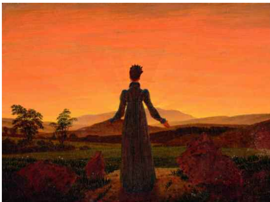
Caspar David Friedrich: Kvinne i solnedgang, 1818.

Av stor historisk betydning er romantikkens natursyn, som gikk imot opplysningstidens mekaniske forståelse av menneskekroppen og den fysiske naturen. Romantikken setter fokus på den levende naturen. Alt levende er besjelet, og det er slektskap mellom menneske og natur, som uttrykt i Wergelands dikt «Mig selv»: «Der er Slægtskab mellem Sjælen og Stjernerne.